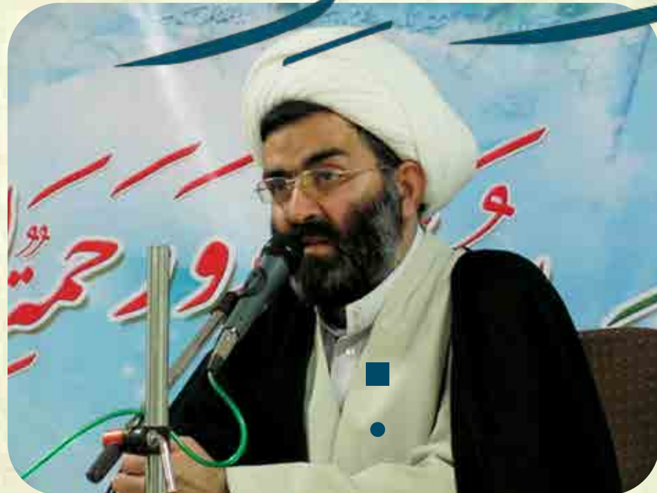
گزیده‌ای از مصاحبه طلاب مدرسه علمیه حضرت زینب سلام الله علیها